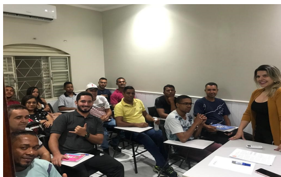
DATA: 23/11/2022 HORÁRIO: 21:47