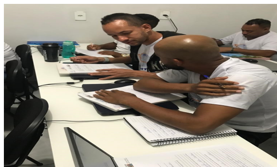
DATA: 16/12/2022 HORÁRIO: 22:15